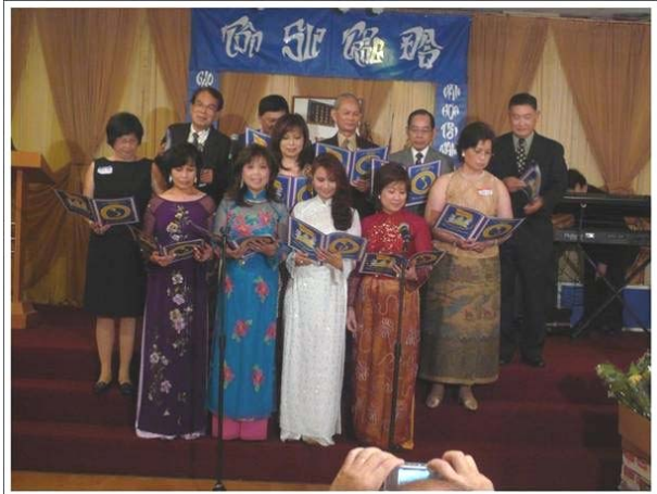
Ban Hợp Ca Liên Trường

Xin mời Quý Thầy Cô và các Anh Chị đóng góp bài vở cho Đặc San 2009.