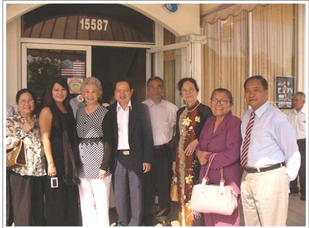
(...Tôi từ Canada về, mong gặp lại người quen...)