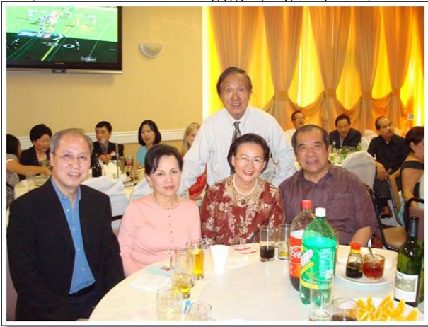
(Buổi họp mặt thật vui....)

Đón xem DVD Họp Mặt 2008, phát hành vào cuối tháng 11/2008.