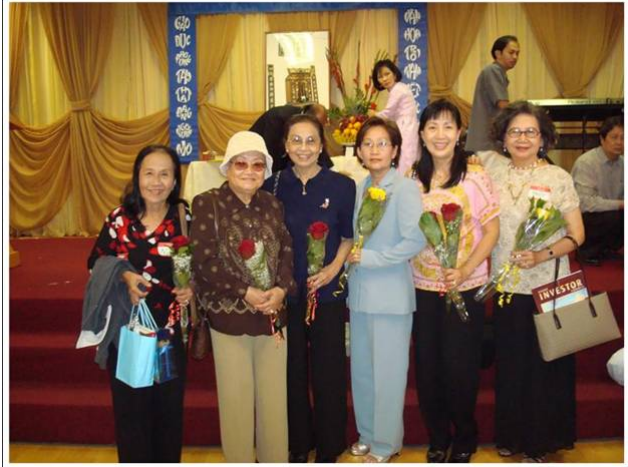
(Tiệc đã tàn, sân khấu đã dọn, nhưng vẫn còn quyến luyến bên nhau)