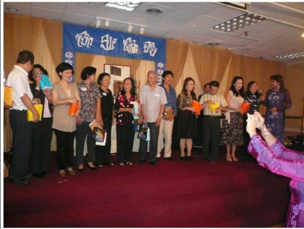
Những CHS và đồng hương từ các Quốc Gia như Pháp, Úc Châu, Canada, Đức, Na Uy, Napal, Việt Nam nhận quà lưu niệm.