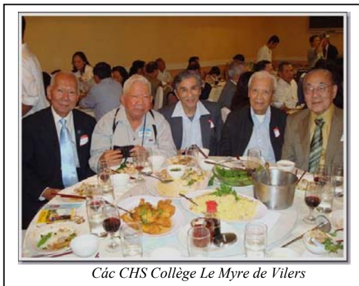
Các CHS Collège Le Myre de Vilers

nam nữ học chung, có cơ hội gần nhau, biết nhau, nhưng những mối tình thơ mộng, lãng mạn, không thấy xảy ra. Cũng có vài chị thuộc hàng người đẹp, bỏ đi lấy chồng khi chưa tròn trung học, nhưng ý trung nhân của các chị là những chàng trai từ xa tới chứ không phải là những bạn bè cùng chung lớp chung trường. Những chiếc áo bà ba duyên dáng, những mái tóc kẹp buông dài theo sóng lưng, những đôi guốc e ấp dưới những ống quần sa ten dài lóng lánh không biết có gây chút xúc động nào cho các anh chẳng? Hoạ hoàng lắm mới nghe nói có một bức thư tình gửi đi mà chẳng có hồi âm. Riêng bọn con gái chúng tôi thì phần đông chỉ quây quần trong đám con gái với nhau, không dám nhìn các anh, không dám để ý đến các anh, còn nói gì đến chuyện yêu thầm nhớ trộm. Chỉ những ngày gần Tết mới có cơ hội tiệc tùng với nhau trong lớp để mừng xuân, mừng thầy, mừng bạn. Rồi thì cuối năm chia tay nhau với chút niềm vương vấn, một chút luyến lưu, một ít cái buồn mông lung để tiễn biệt nhau, không hẹn còn gặp lại. Tất cả những phút giây vui buồn đó đã tích lũy thành kho kỷ niệm. Những kỷ niệm sống mãi trong lòng người dù nó có bị bao lần vùi dập với thời gian.