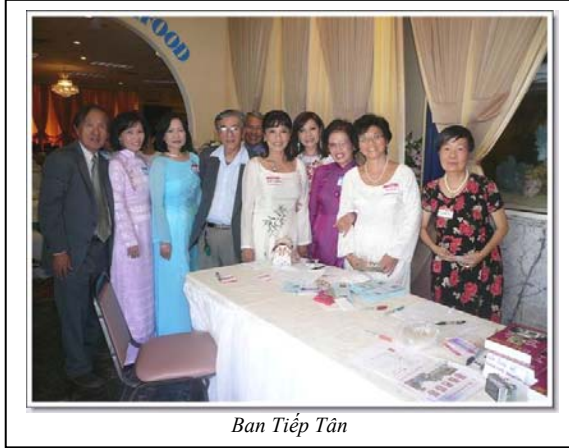
Ban Tiếp Tân