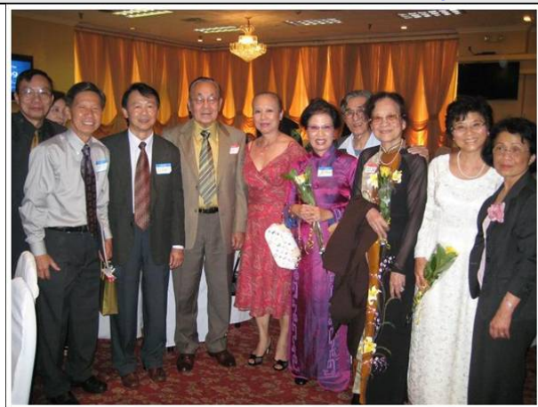
Về từ Đức Quốc, Florida, Nevada, San Diego, Riverside, Bắc và Nam California. Hẹn nhau vào năm sau...

Tin Vui: Tác phẩm "Nature" (Thiên-Nhiên) của CHS Hồ Mỹ Xuân đã được nhận vào cuộc triển-lãm "Mosaic Arts International 2009" của hội SAMA (Society of American Mosaic Artists) ở San Diego từ ngày 28/2 /2009 đến ngày 26/4/2009 tại "The Museum of Man".