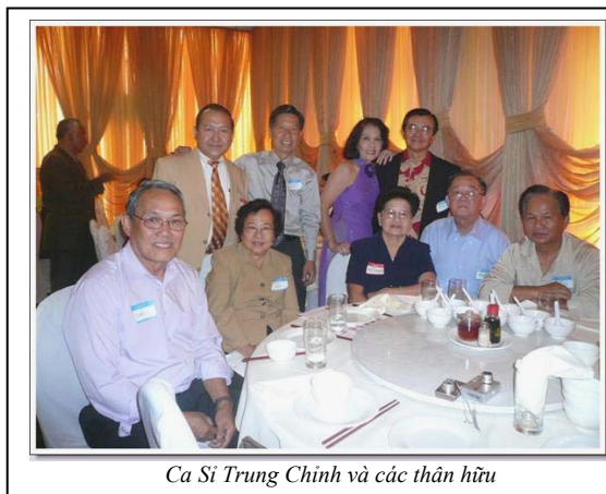
Ca Sĩ Trung Chính và các thân hữu