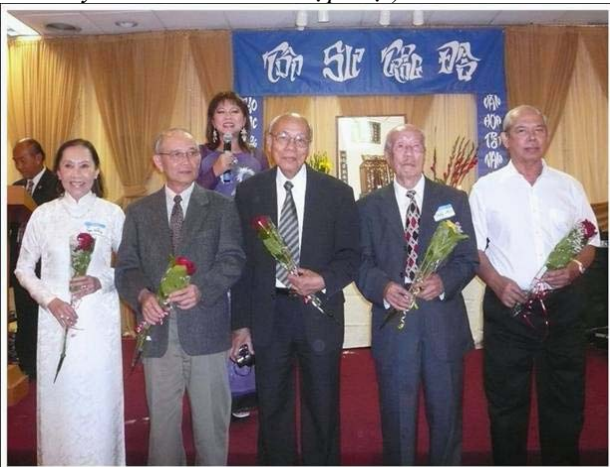
(Quý Thầy Cô nhận những bông hoa từ các CHS NĐC & LNH)

(Xin mời vào Website: www.ndclnhamcali.org để xem đầy đủ các hình ảnh họp mặt)